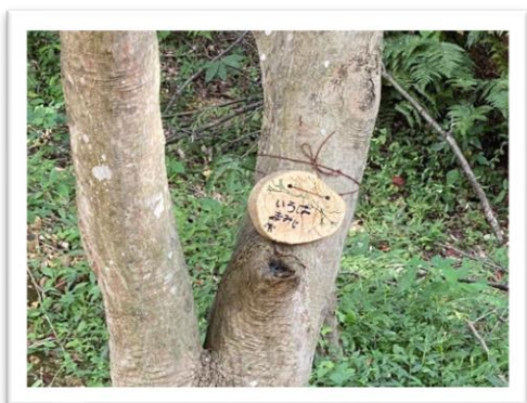
素敵な木の名札が出来上がりました。この名札は、金ヶ崎公園の木でできているんですよ(*^_^*)