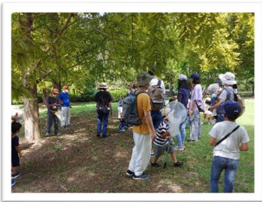
虫取り網を持ってきた子もいました。お目当ての昆虫は見つかったかな？