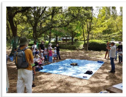
10時に説明を受けてスタートです。今回は、木の名札を作りますよ。